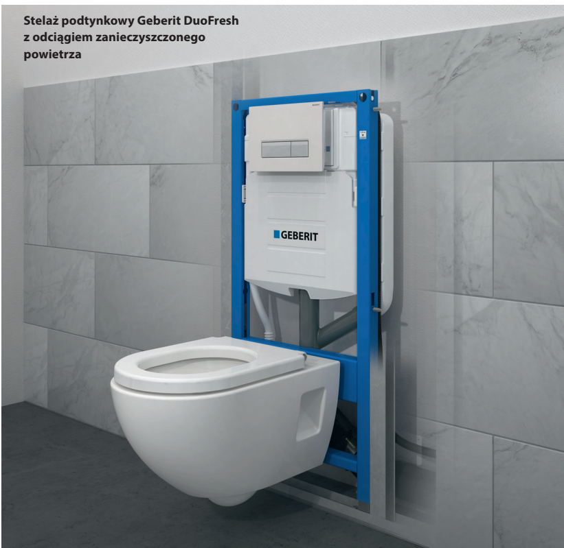
Stelaż podtynkowy Geberit DuoFresh z odciąganiem zanieczyszczonego powietrza

Model Geberit Monolith Plus posiada szereg dodatkowych funkcji: moduł sanitarny WC ze zintegrowaną spłuczką i funkcjami: wykrywania użytkownika, soft-touch, dyskretne podświetlenie LED, zintegrowany system odciągu zapachów, nowoczesna technologia.