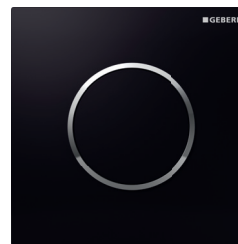
Sigma10 do pisuarów