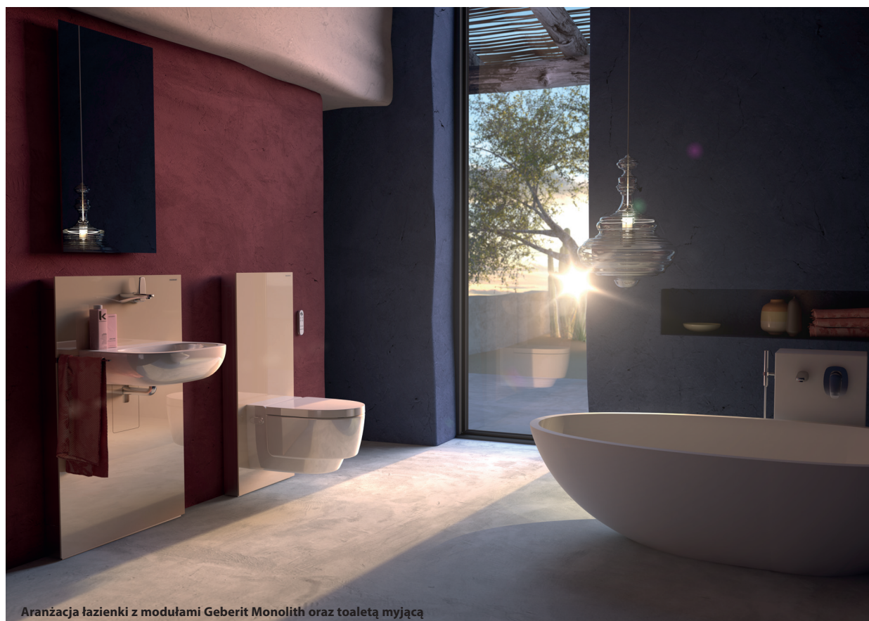
Aranżacja łazienki z modułami Geberit Monolith oraz toaletą myjącą

MATERIAŁY DO INSTALACJI / STELAŻE DO PRZYBORÓW SANITARNYCH